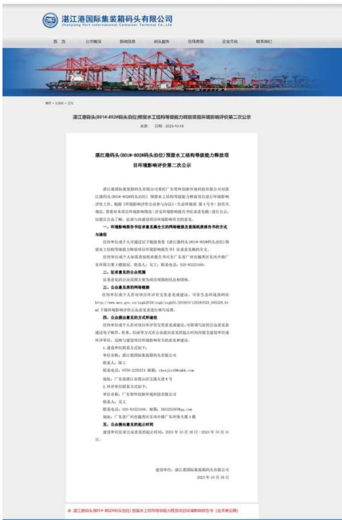
图 3.2.1-1 第二次网上公示网页截图