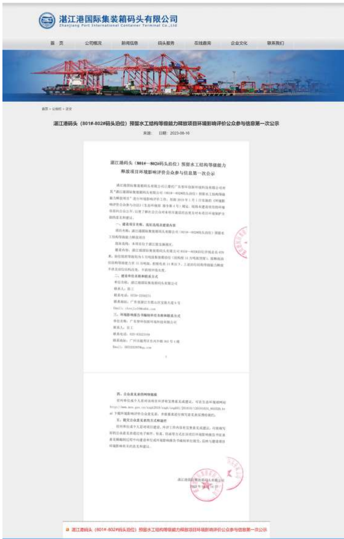
图 2.2.1-1 第一次网上公示网页截图