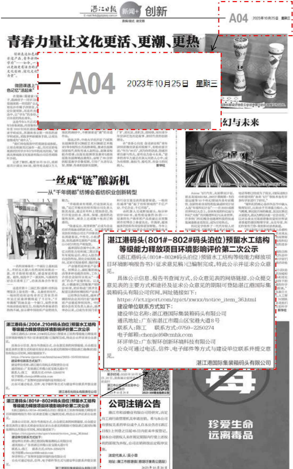
图 3.2.2-1 10月25日湛江日报公示照片